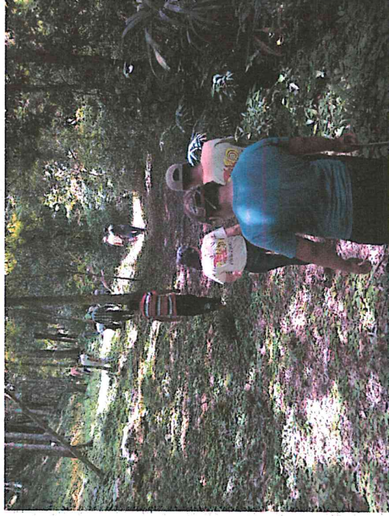
Fig. 8: Recorrido por el área durante capacitación de guardarecursos

Se apoyó a la unidad de educación y fomento de CONAP en la capacitación “Manejo adecuado de biodiversidad” mediante el tema de rastros y excretas a guardarecursos de áreas protegidas de Petén, incluyendo del PNYNN.