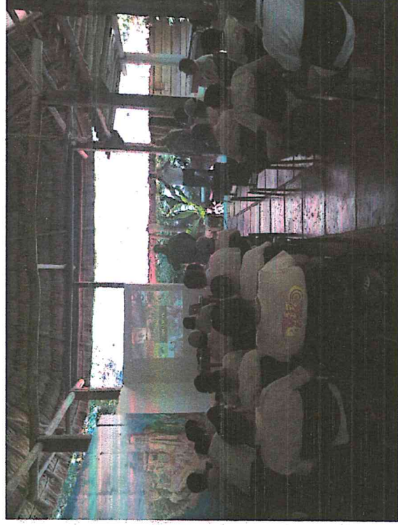
Fig.6: Capacitación del diplomado “Seguridad integral en áreas protegidas del SIGAP”

Continúa el diplomado en el que participa el personal operativo del PNYNN. Durante septiembre estarán recibiendo capacitaciones sobre gestión de riesgo, entre otros temas.