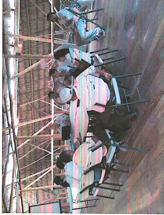
Fig.5: Reunión sobre el Sello Q

Con una de las consultoras del Intecap que elabora los manuales y procedimientos del Sello Q y el personal técnico, administrativo y operativo. En esta reunión se discutieron los temas administrativos y de salud y seguridad ocupacional, además de la conformación de los comités de calidad y de salud y seguridad ocupacional.