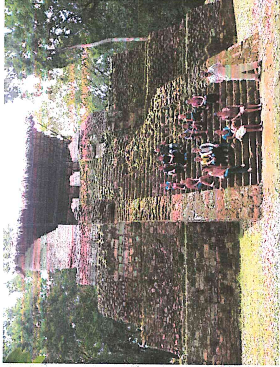
Fig.9: Visita a sitio arqueológico Topoxte con estudiantes de la escuela del caserío Yaxha.