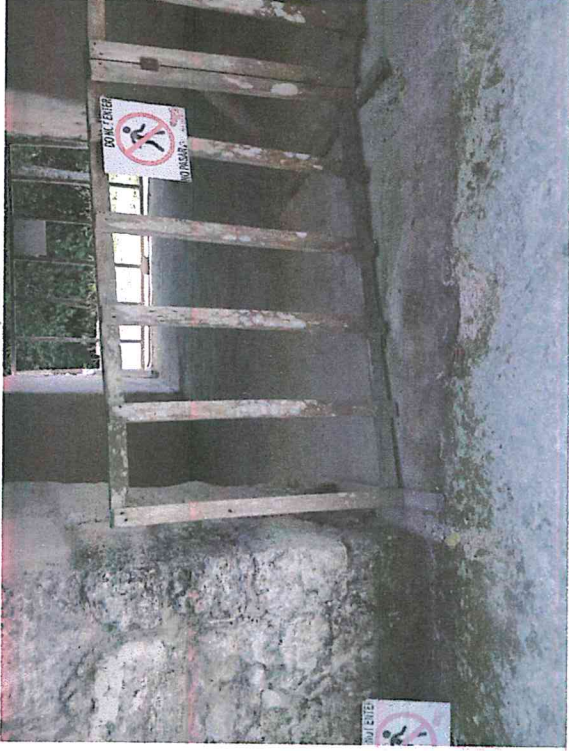
Fig.1: Necesidad de mantenimiento en cámara de acrópolis sur